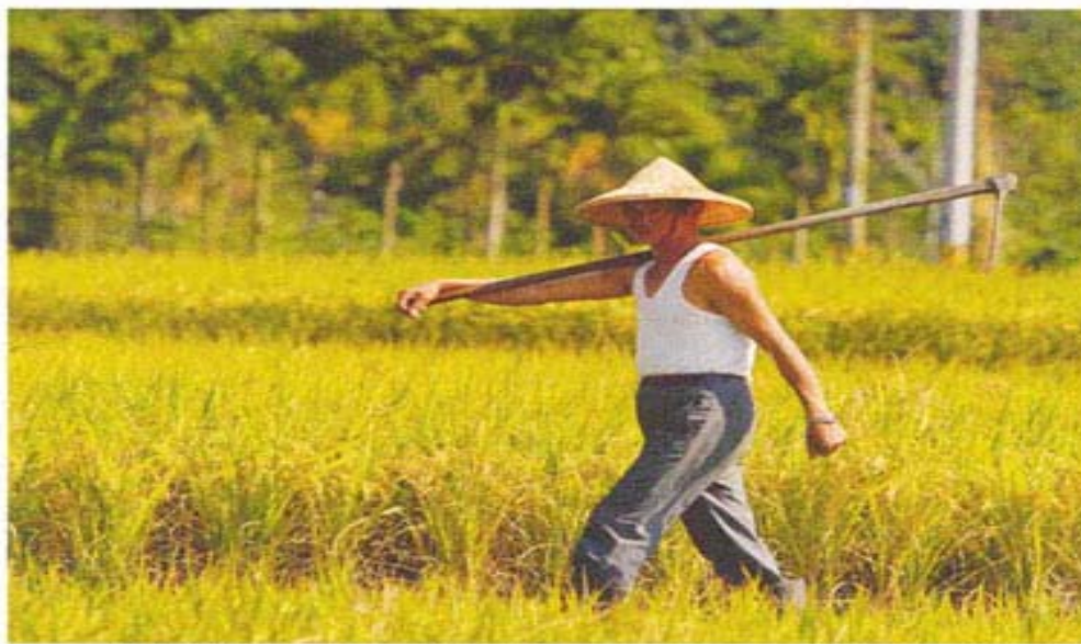
荷鋤的農夫是農村司空見慣的情景。