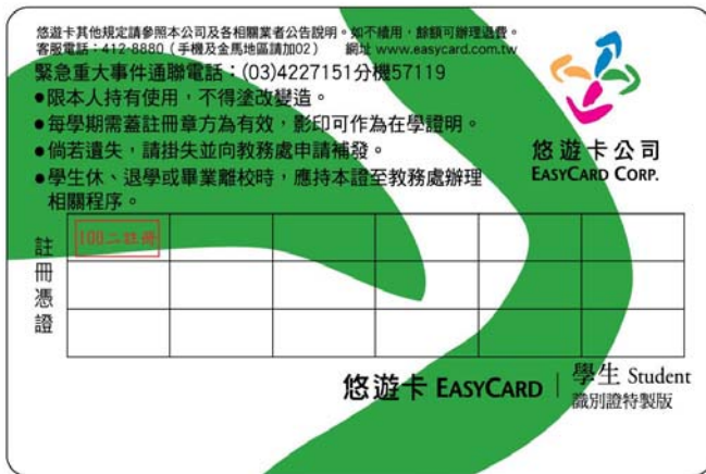
悠遊卡學生證(背面) 具悠遊卡儲值功能